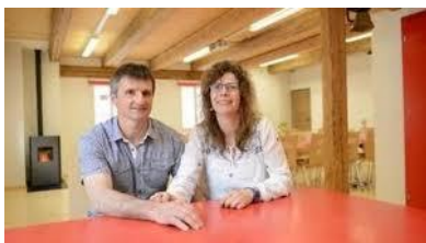
Die Mitgliederversammlung findet im Seminarraum « Heuboden » der Familie Danuser in Felsberg statt. Infos : www.biohof-danuser.ch

Die 5. Mitgliederversammlung des Vereins Agrotourismus Graubünden findet am Mittwoch, 10. April 2019 um 11.00 Uhr auf dem Biohof Danuser in Felsberg statt. Anschliessend an die Mitgliederversammlung werden alle Mitglieder zu einem Essen eingeladen. Es freut uns sehr, dass der Verein kontinuierlich wächst und wir heute bereits 125 Mitglieder haben. Informiert Euch an der Mitgliederversammlung über die Aktivitäten des Vereins und wir freuen uns auf einen regen Austausch mit Euch.