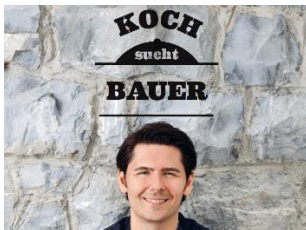
Direkte Zusammenarbeit bringt Wertschöpfung

Am Mittwoch, 10. April 2019 findet um 13.30 Uhr der erste regionale Stammtisch für Agrotouristiker und Direktvermarkter auf dem Biohof Danuser in Felsberg statt. In einem direkten regionalen Austausch können Bäuerinnen und Bauern Ihre Produkte oder Angebote mitnehmen, die Gastronomen Ihre Menükarten oder Angebote. Der Austausch soll ein regionales Netzwerk der Zusammenarbeit öffnen – eine Teilnahme lohnt sich. Es werden übers Jahr 2019 weitere Stammtische in verschiedenen Regionen angeboten. Weitere Infos und Einladung sind diesem Mail beigelegt oder auf unserer Homepage. – Wir freuen uns auf eine rege Teilnahme!